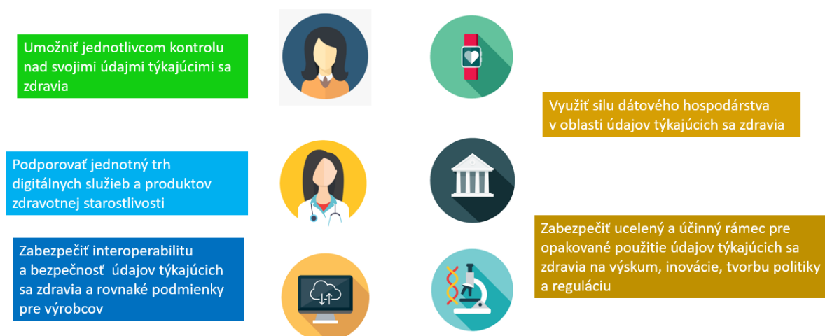
Obrázok 1 – Hlavné ciele európskeho priestoru pre údaje týkajúce sa zdravia

využívania na lepšie poskytovanie zdravotnej starostlivosti, a na to, aby EÚ mohla v plnej miere využívať potenciál, ktorý ponúka bezpečná a zabezpečená výmena, využívanie a opätovné používanie údajov týkajúcich sa zdravia, a to bez existujúcich prekážok.