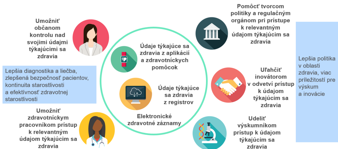
Obrázok 4. Výhody pre používateľov európskeho priestoru pre údaje týkajúce sa zdravia

Jednotlivci získajú väčšiu kontrolu nad svojimi zdravotnými údajmi. Ak si to želajú, budú môcť svoje údaje rýchlo a v jednoduchom, transparentnom a spoločnom formáte poskytnúť ľubovoľnému zdravotníckemu pracovníkovi. Zníži sa tým počet zbytočných vyšetrení a nákladov a zároveň sa zvýši bezpečnosť zdravotnej starostlivosti. Vďaka možnosti získať prístup k zdravotným údajom, analyzovať ich a spoločne ich využívať sa zefektívni zdravotná starostlivosť, podporia sa lepšie lekárske rozhodnutia, a tak sa dosiahnu lepšie výsledky v oblasti zdravia. Európsky priestor pre údaje týkajúce sa zdravia pomôže naplniť víziu Komisie, pokiaľ ide o digitálnu transformáciu EÚ do roku 2030 40 , dosiahnuť cieľ Digitálneho kompasu poskytnúť všetkým občanom prístup k ich zdravotným záznamom a dodržať vyhlásenie o digitálnych zásadách 41 . Bude vychádzať z návrhu Komisie na rámec pre európsku digitálnu identitu a peňaženku digitálnej identity, ktorý umožňuje občanom dôveryhodný cezhraničný prístup k svojim zdravotným údajom prostredníctvom mobilných zariadení.