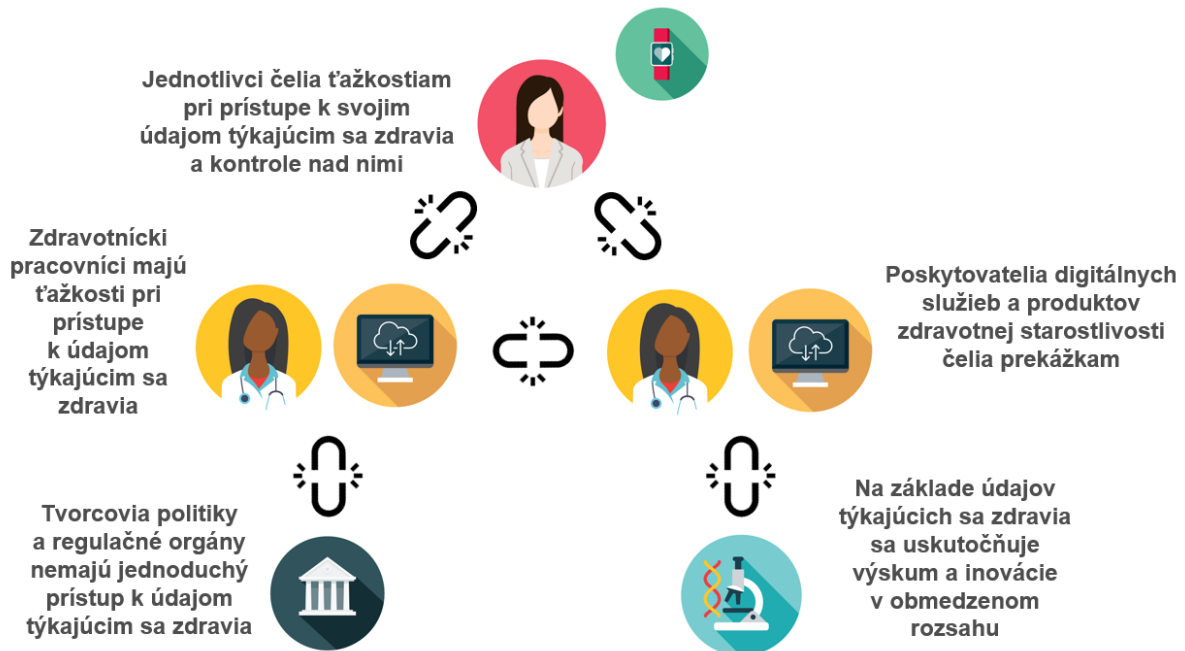
Obrázok 2 – Problémy pri kontrole, využívaní a zdieľaní zdravotných údajov

Obmedzené používanie údajov týkajúcich sa zdravia brzdí tvorcov politik a regulačné orgány na ceste k účinnejšej a efektívnejšej zdravotnej starostlivosti a politike v oblasti verejného zdravia, ktoré sú nevyhnutné pre účinné krízové riadenie. Výrazne sa to prejavilo počas pandémie ochorenia COVID-19, keď sa Európske centrum pre prevenciu a kontrolu chorôb a Európska agentúra pre lieky usilovali získať rýchly prístup k údajom a dôkazom potrebným pre rozhodnutia a vedecké usmernenia týkajúce sa reakcie na pandémiu.